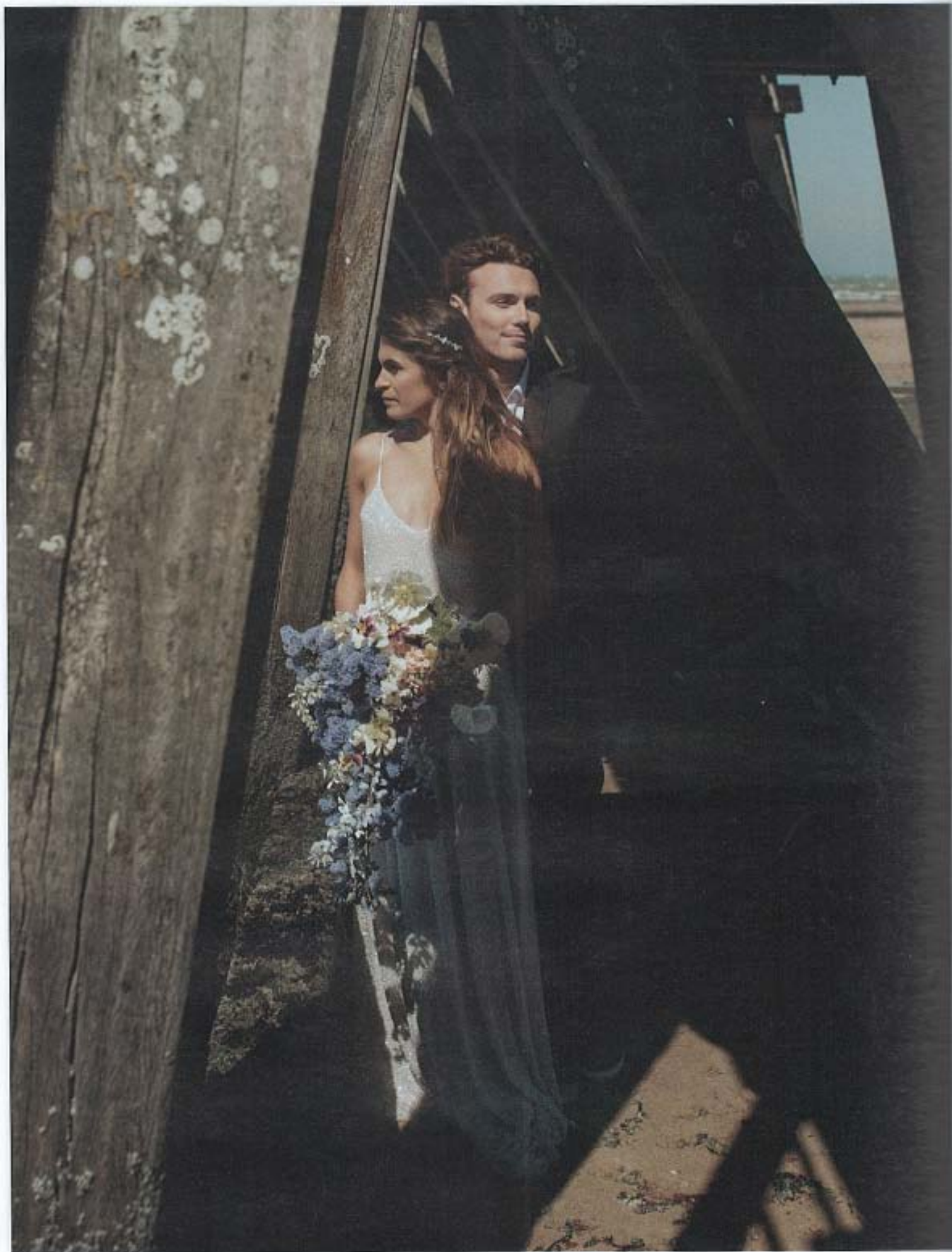
ELLE Robe Elise Martimort Collier et BO - OR DU MONDE Lui Costume Father and Sons