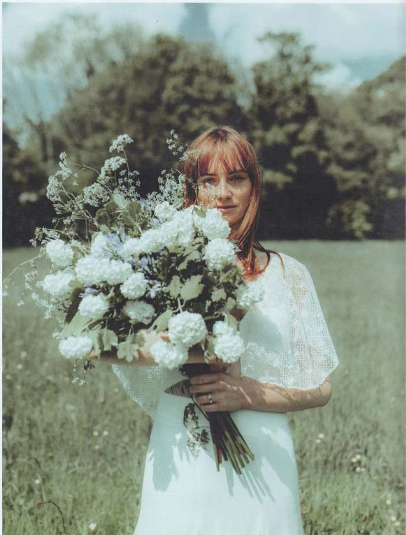
Aurélie Robe Amarildine Bague OR DU MONDE