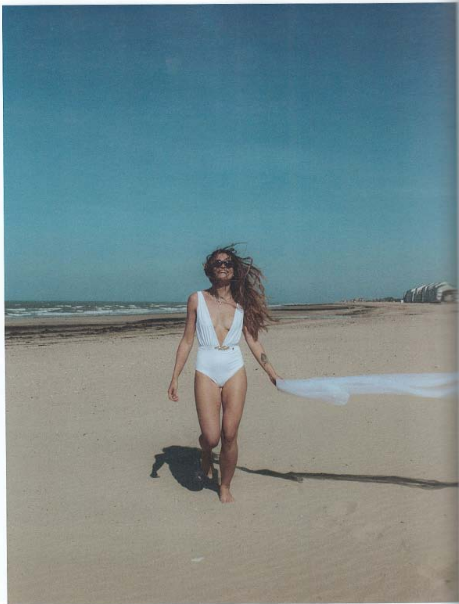
Maillot de bain Anne de Lafforest x Coco Frio - Voile Cymbeline - Collier OR DU MONDE