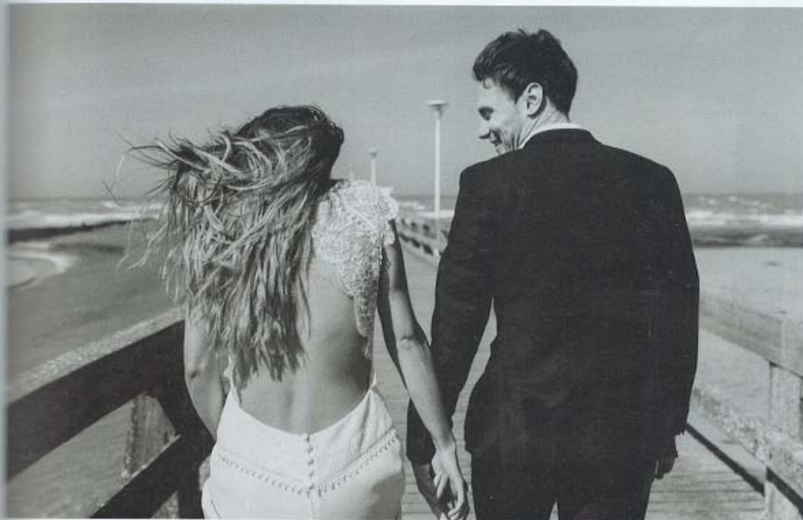
ELLE Robe Aurélia Hoang - Collier et BO OR DU MONDE - Barette SUZANNE ceremony LUI Costume Father and Sons