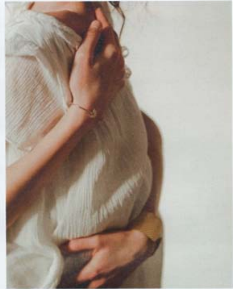
Amandine Bague Zeina Alliances Bracelet Histoire d'or Robe Amarildine Boucles d'oreille Les Merveilleuses Paris Livia Robe Les petits Inclassables Peigne English Garden Zoé Robe Elisa Ness Bague OR DU MONDE Barrette SUZANNE Ceremony Zélie Robe Les petits Inclassables Couronne English Garden