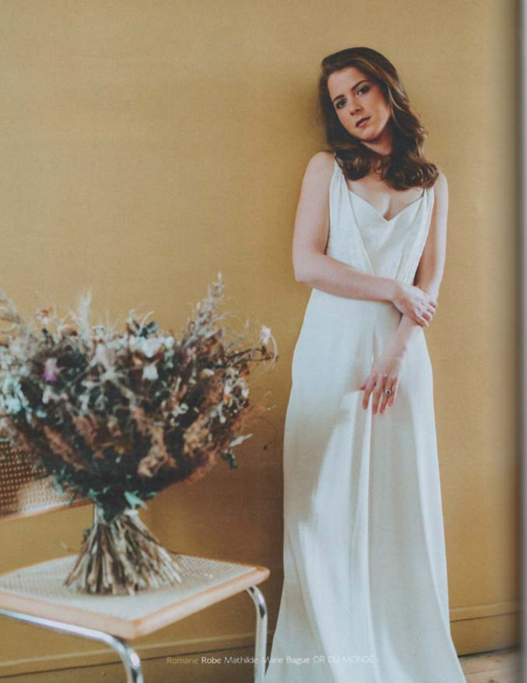
Romane Robe Mathilde Marie Bague OR DU MONDE