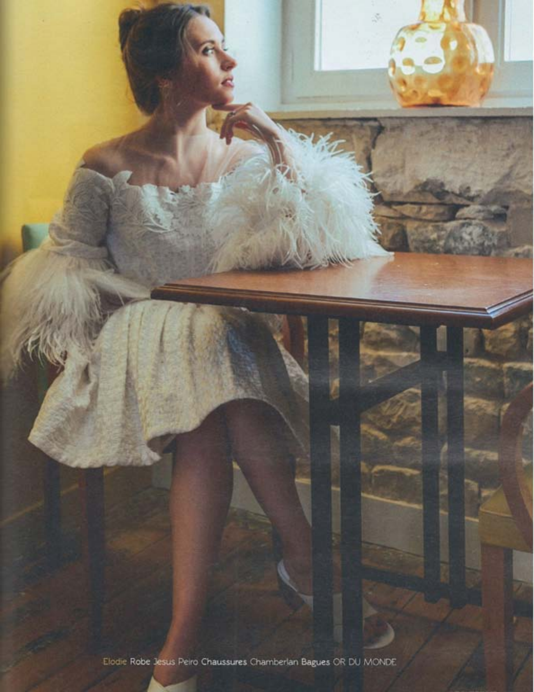
Elodie Robe Jesus Peiro Chaussures Chamberlan Bagues OR DU MONDE