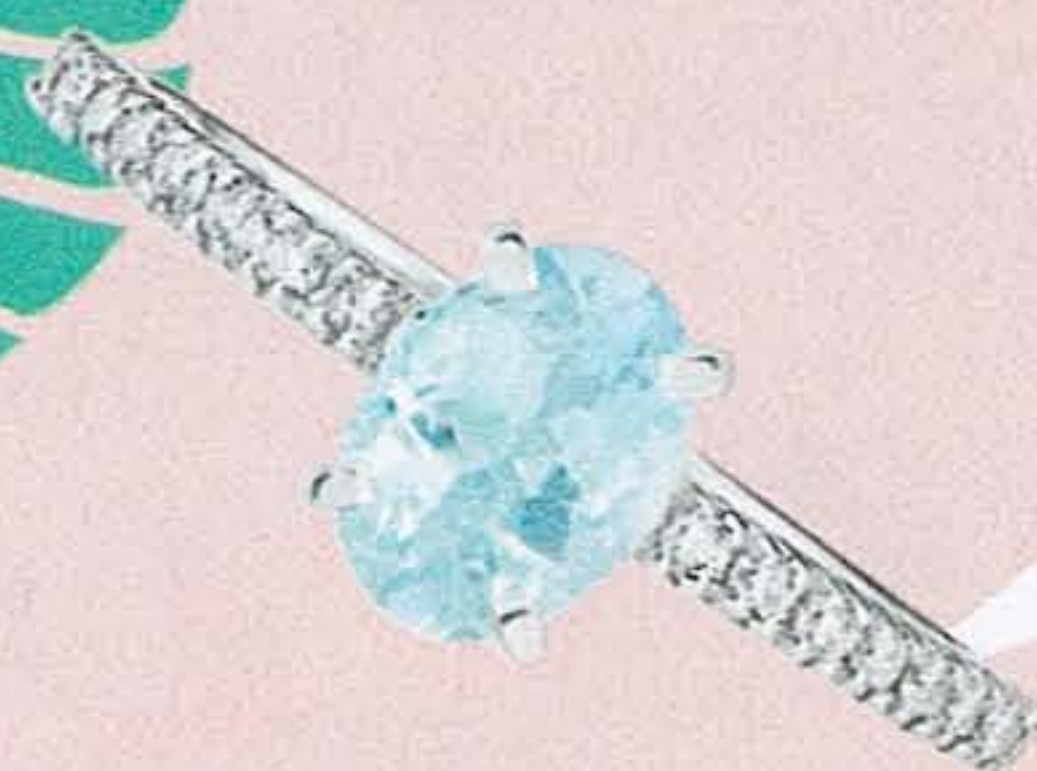
Solitaire « Corinthe Aigue-Marine » Or du Monde