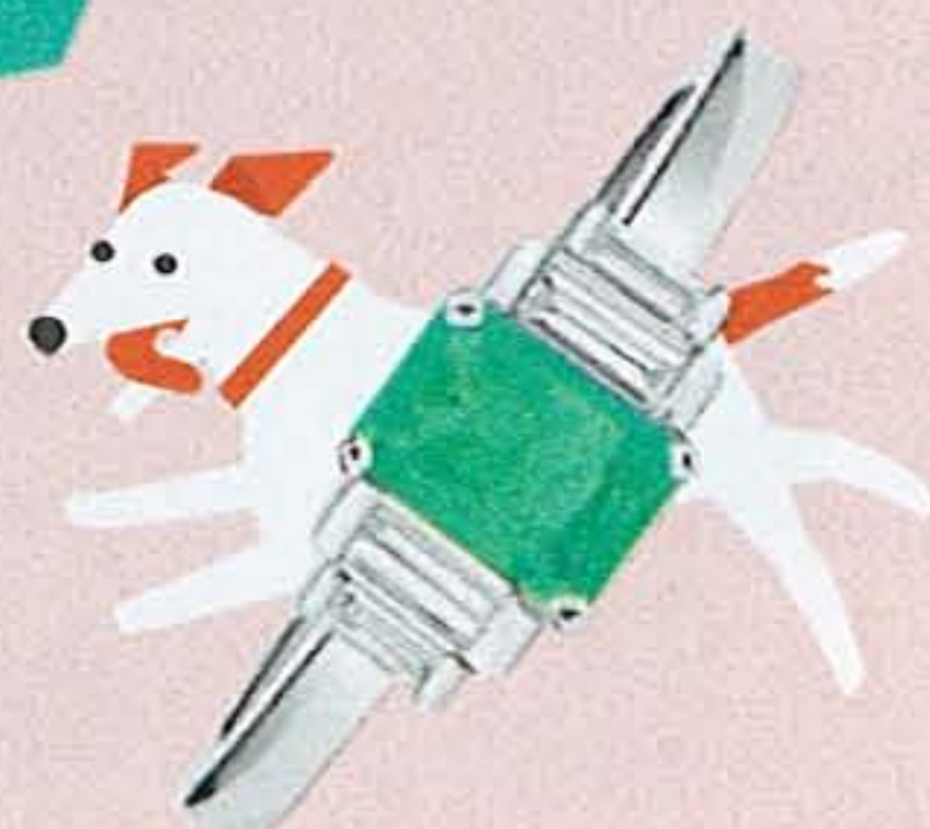
Solitaire « Gatsby Émeraude » Or du Monde